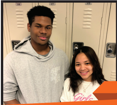
Editors in Chief