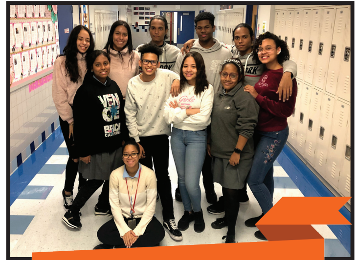
The General Staff